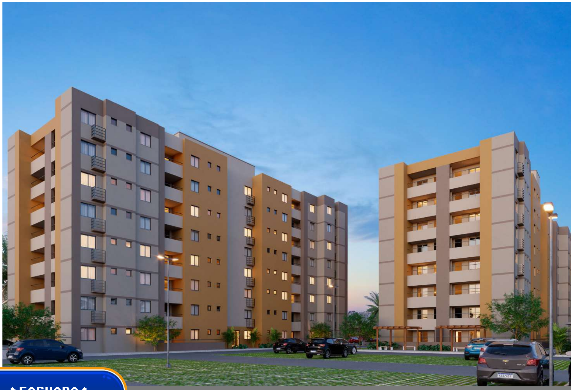
♦ FACHADA ♦