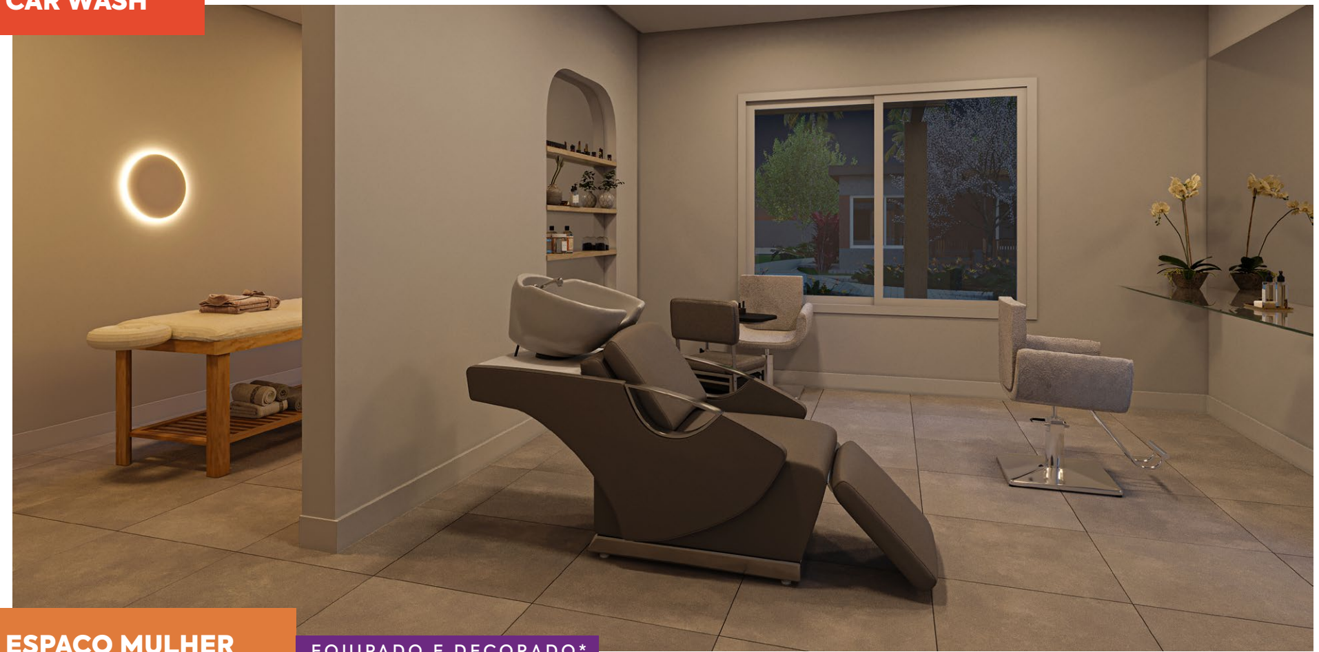
*Imagem meramente ilustrativa. Espaços entregues conforme memorial descritivo