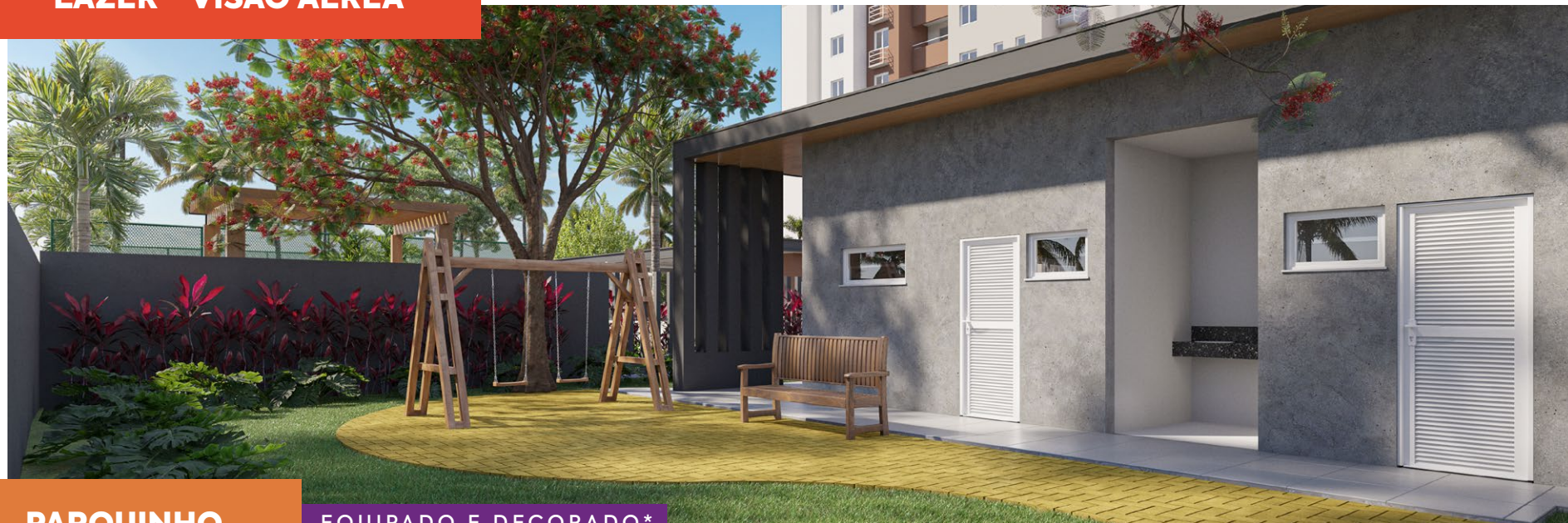
*Imagem meramente ilustrativa. Espaços entregues conforme memorial descritivo