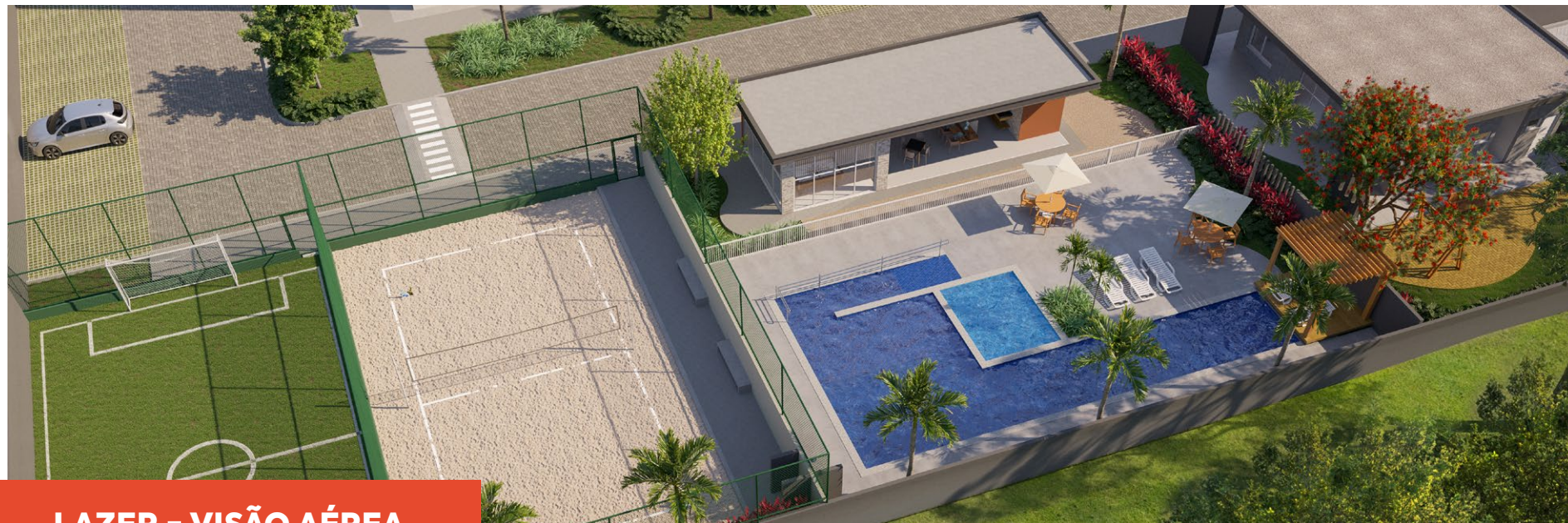
*Imagem meramente ilustrativa. Espaços entregues conforme memorial descritivo