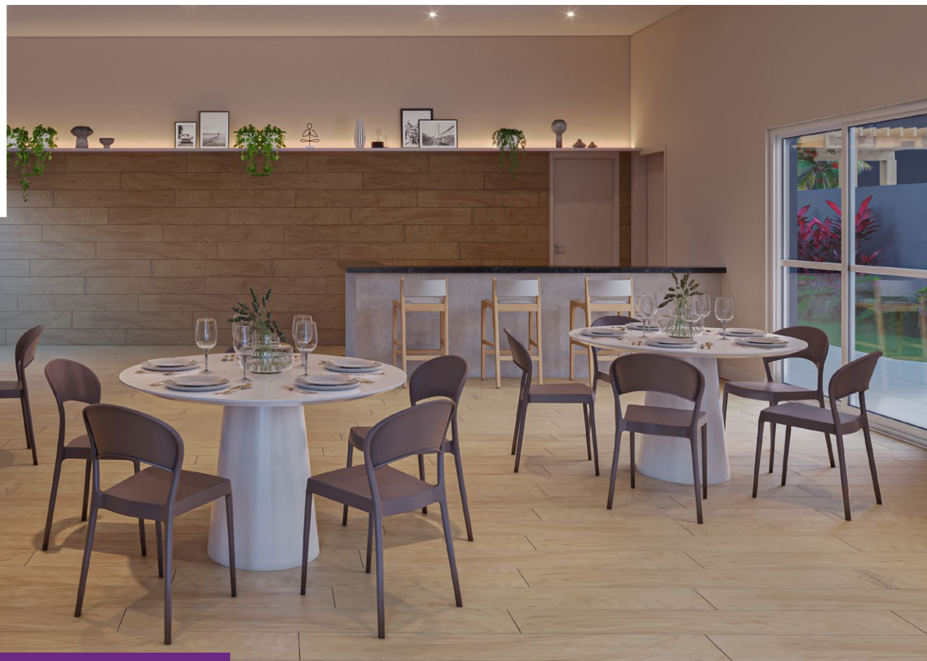
*Imagem meramente ilustrativa. Espaços entregues conforme memorial descritivo