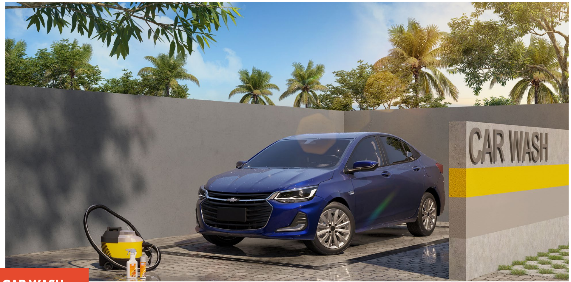
*Imagem meramente ilustrativa. Espaços entregues conforme memorial descritivo