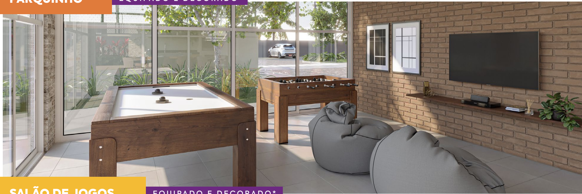
*Imagem meramente ilustrativa. Espaços entregues conforme memorial descritivo