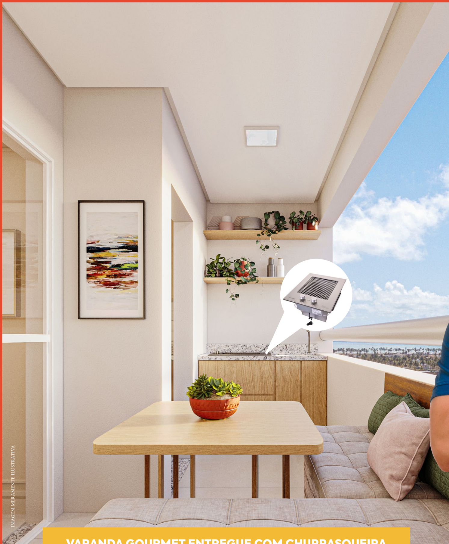
VARANDA GOURMET ENTREGUE COM CHURRASQUEIRA

Dentro do Coral Village, o novo empreendimento da Primasa. Na melhor localização da Barra dos Coqueiros. Na menor das parcelas. Com o maior dos sorrisos: o seu.