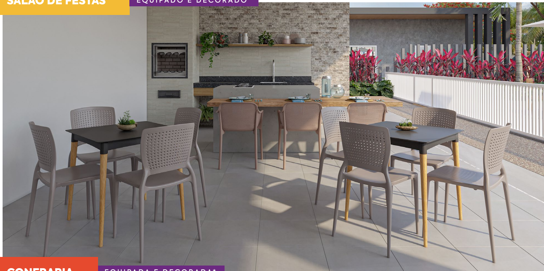
*Imagem meramente ilustrativa. Espaços entregues conforme memorial descritivo