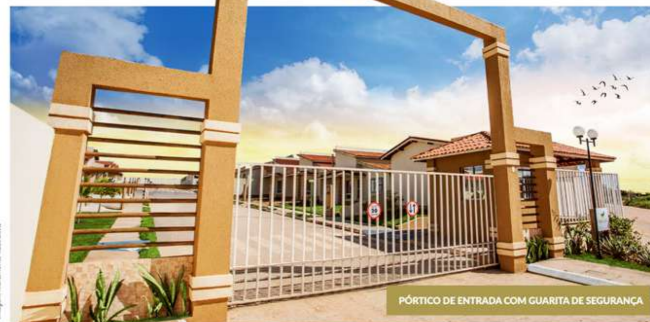
PÓRTECO DE ENTRADA COM GUARITA DE SEGURANÇA

Gleidiano do Aço – Empresário Proprietário da Casa 33 do Golden View