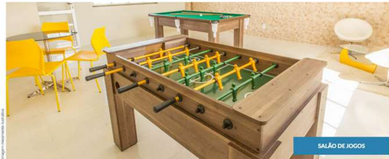
SALÃO DE JOGOS